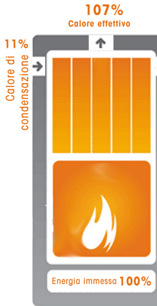
Caldaia a condensazione